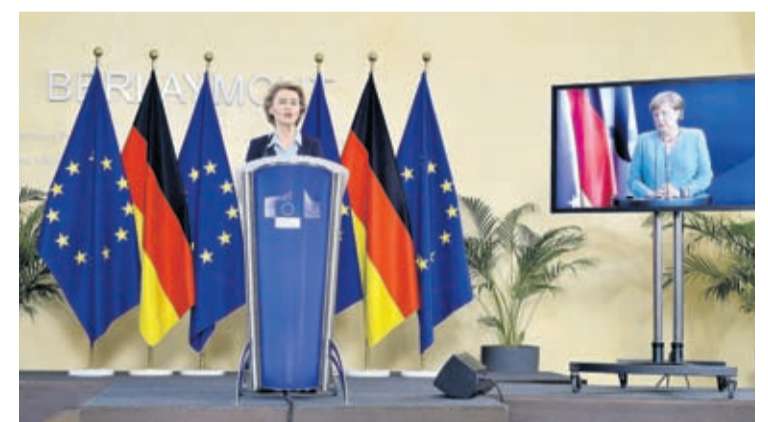
President of the European Commission Ursula von der Leyen, left rear, addresses a joint press conference with German Chancellor Angela Merkel, attending by video conference on screen right, at the start of the six month German Presidency of the EU at EU Headquarters in Brussels, Thursday, July 2, 2020.

"Hong Kong is still the most important hub for China's economic exchange with Europe, not least because of the city's (...) special sta-